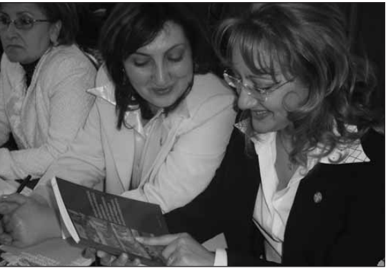
Հետազոտության էլեկտրոնային տարբերակը երեք լեզուներով՝ հայերեն, ռուսերեն և անգլերեն, դուք կգտնեք http://www.osce.org/yerevan/ կայքում:

Այնուամենայնիվ, ի՞նչն է խանգարում ընտրություններում կանանց հաջողությանը: Ինչո՞ւ են կանանց թեկնածությունները մեծ մասամբ համարվում ոչ անցողիկ: Ո՞ր կանայք են առաջադրվում խորհրդարանում և ինչո՞ւ: Ի՞նչ տարիքի և ի՞նչ մասնագիտության: Քաղաքականություն մտնելու ո՞ր սցենարներն են առավել բնորոշ կանանց: Քաղաքական քվոտավորումն օգնո՞ւմ է արդյոք կանանց: Այս և բազմաթիվ այլ հարցերի պատասխանները կարող եք գտնել վերոնշյալ հետազոտության արդյունքների հիման վրա հրատարակված «Կանանց քաղաքական մասնակցությունը Հայաստանի Հանրապետության 2007 թ. խորհրդարանական ընտրություններին» գրքում: