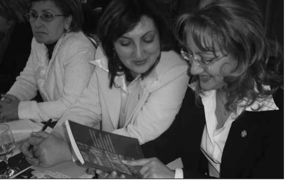
Իր հետագա հրապարակումներում «Կինը և քաղաքականությունը» ավելի հանգամանորեն կանդիդատներ այդ հետազոտության նյութերին: