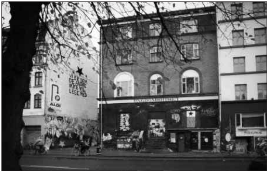
Так выглядел перед сносом исторический дом, в котором был провозглашен праздник 8 Марта.

Казалось, историю возникновения праздника 8 Марта мы знаем наизусть. Но есть в ней интересные штрихи, которые не слишком известны широкому читателю.