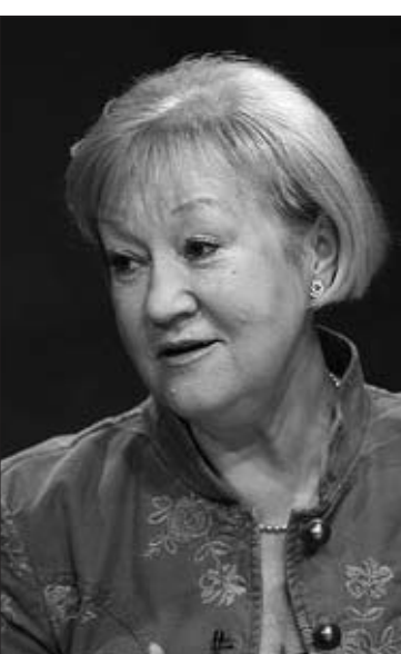
Քաղաքականության մեջ կնոջ համար գլխավորը չկախեցնալն է: Ժամանակին ֆրանսիացի ֆեմինիստուհիները նման կարգախոս ունեին: «Համարձակվել պայքարել»:

Ի մ կարծիքով՝ ամենաուսանելի Մարգարետ Թեյտչերի օրինակն է, որն ի դեպ գեներալային իրավասակառույթումն էր: Նա շատ լրջորեն էր վերաբերվում իր քաղաքական կարիերային: Սկսել էր ոչ այնքան հաջող, բայց, այնուամենայնիվ, առաջ էր գնում հենվելով կամքի ուժի և հսկայական գիտելիքների վրա: Ինչ-որ մի իմիջմեյքերի հետ, որը խորհուրդ է տալիս Թեյտչերին ընդգծել շրթունքները: Նա աշխատում էր տղամարդկանց աշխարհում, իբրև կին պետք է հրապարակել լինի, բայց և միաժամանակ իրեն պահի և մտածի տղամարդու պես: Հետևելով այս խորհրդին՝ նա տարիներով մշակեց իր կերպարը: Բանակցությունների սեղանի շուրջը