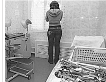
Կյանք պարզելի ինձ

Ենթագիտակցաբար վնասել իրեն ու պտղին, եթե պարզվի, որ երեխան այն սեռի չէ, որը կկամենար ինքը կամ նրա հարազատները: Նա ենթերուստ տրամադրում է իրեն երեխայի դեմ, իսկ դա ուղղակիորեն ազդում է