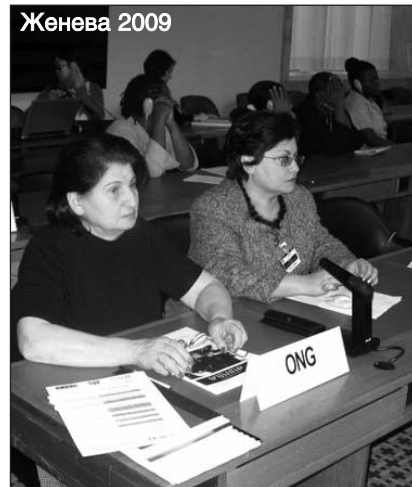
Женева 2009 сударством концепции гендерной политики и закона о гарантиях равных прав и равных возможностей для мужчин и женщин. И концепция, и за-

Ратифицировав в 1993 году Конвенцию CEDAW, Армения, по сути, сделала ее частью своего национального законодательства и тем самым взяла на себя обязательство за периодическую отчетность и выполнение рекомендаций по представленным отчетам. С этой точки зрения совершенно непонятно, почему до сих пор, а прошел уже фактически год, ни правительство Армении, ни Национальное собрание никак не отреагировали на эти рекомендации, хотя их реализация не требовала каких-либо финансовых ресурсов. Настораживает факт, что некоторые рекомендации повторяются после каждого очередного отчета. К примеру, постоянно говорится о необходимости ознакомить с заключением Комитета властные структуры и общественность, однако никому, в том числе и средствам массовой информации, ничего об этом не известно. Далее в рекомендациях говорится о необходимости принятия го-