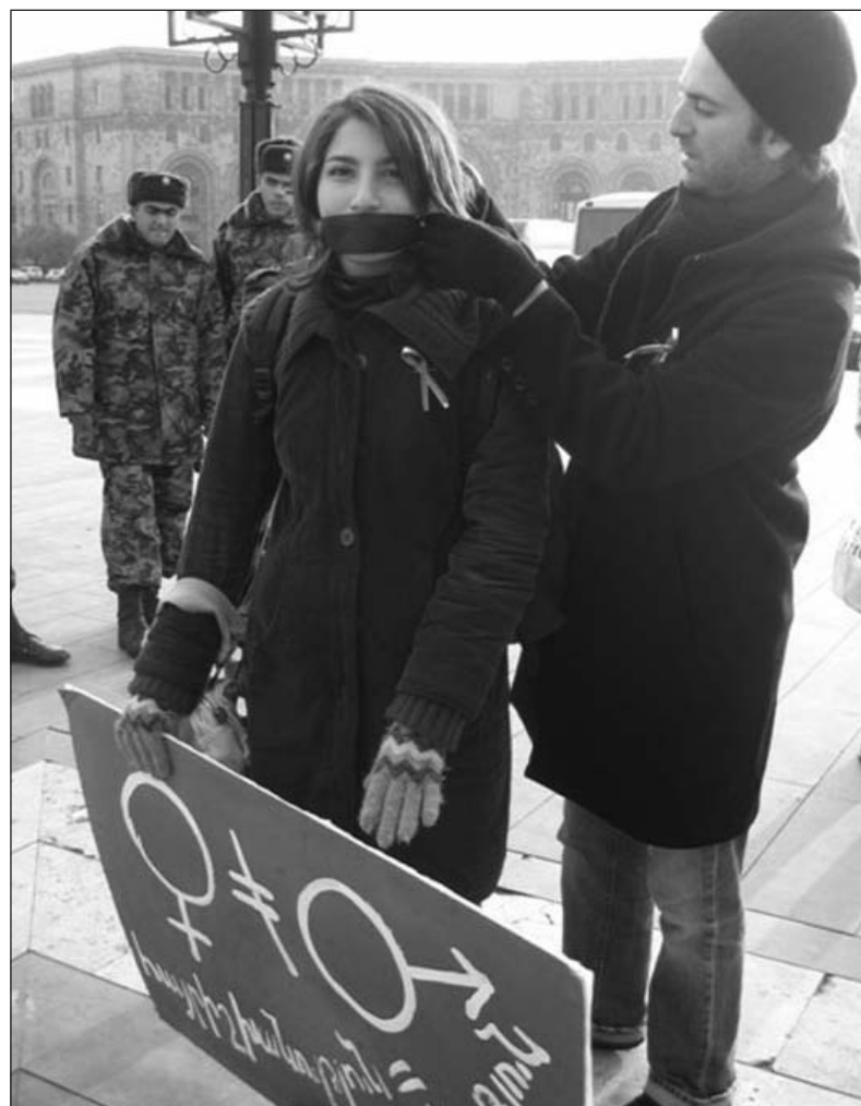
Дискриминация начинается с молчаливого согласия...

Достаточно сильны в обществе и стереотипные представления о месте и роли женщины. К примеру, 46% опрошенных, которые выражают свое абсолютное согласие с установкой "Политика не женское дело" — это свидетельство серьезной силы этого стереотипа в армянском обществе. При этом вызывает беспокойство, что 40% подверженных этому стереотипу респондентов — женщины. "Женщины сами дискриминируют женщин. Недоверием дискриминируют. На этом недоверии строится засилье мужчин в политике и во власти. Подумайте, кто