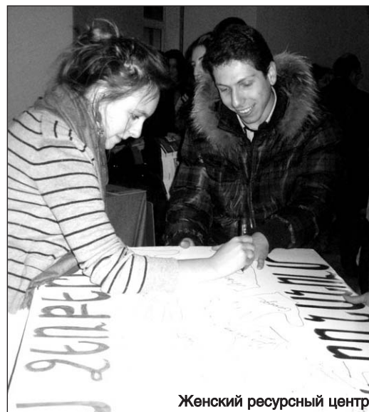
Женский ресурсный центр