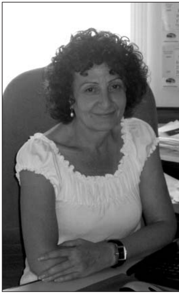
թյունները՝ գերազանցապես կանայքն են, որ ամբողջ աշխարհում ավելի շատ աղքատ են կանայք, քան տղամարդիկ: Կանանց նկատմամբ խտրական դրսևորումները նկատելի են ոչ միայն սոցիալական, այլև քաղաքական, տնտեսական, քաղաքացիական առումներով: Այսպես, կարծիք չունի նաև այն, որ կենցաղում իր ունեցած ընկած բազմաթիվ պարտականությունների համար կինը չի վարձատրվում, աշխատում է անվճար, ասես դա «ի վերուստ» նրա կոչումը լինի: Հենց այս կրկնակի ծանրաբեռնվածությունից էլ սկսվում է խտրականությունը: Այն շարունակվում է գործի տեղում, երբ մույն աշխատանքի դիմաց կանայք, որպես կանոն, ավելի քիչ են վարձատրվում, քան տղամարդիկ: Մի խոսքով, կանայք, կարծես, ավելի ստորադաս պայմաններում են, և հատկապես դա դրսևորվում է որոշում կայացնելու մակարդակում: Խոսում օրինակ է Հայոց խորհրդարանը, որում կանանց ներկայացվածությունը 10%-ի էլ չի հասնում, այն պարագայում, երբ աշխարհում միջին ցուցանիշը 18.5% է: Մեր ծրագրերի շրջանակներում կատարված ուսումնասիրությունները ցույց են տվել, որ տեղական ինքնակառավարման մարմիններում էլ կանանց ներկայացվածությունը չափազանց ցածր է: Այստեղ պետք է հաշվի առնել մի քանի գործոններ, որոնց շարքում ամենաազդեցիկը հասարակության մեջ իշխող կարծրատիպն է՝ ղեկավար պաշտոնում պետք է տղամարդ լինի: Դրա հետ մեկտեղ կանայք հաճախ թերազնահատում են իրենց հնարավորու-