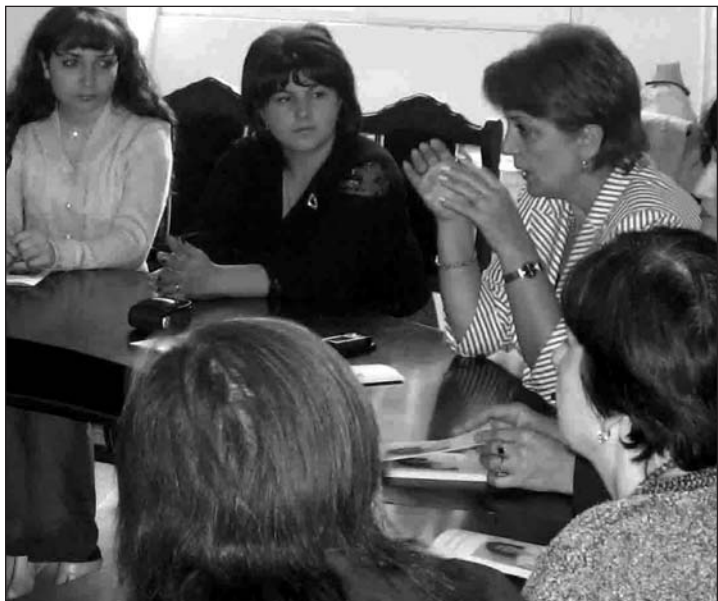
Դիլիջանում «Հուլյա կամուրջ» ՀԿ-ի կանանց շահերի պաշտպանության խմբի հավաքներից մեկում

Այսպես է կոչվում այն եռամյա ծրագիրը, որն իրականացնում է ՕԲՄՖԱՄ-ի գործընկեր «Հուլյա կամուրջ» հասարակական կազմակերպությունը Տավուշի մարզի 4 քաղաքներում՝ Դիլիջանում, Իջևանում, Նոյեմբերյանում և Բերդում: Ծրագրի նպատակն է խթանել կանայքի կանանց մասնակցությունը որոշումների կայացման գործընթացում և ընդհանուր առմամբ բարձրացնել նրանց ակտիվությունը: Ծրագրի առանձնահատկությունն այն է, որ նրա թիրախ խմբում են առավել խոցելի համայնքները հաշմանդան կանայք և հաշմանդան երեխաների մայրեր: Անցյալ տարվա հոկտեմբերից ծրագրի շրջանակներում ձևավորված Կանանց շահերի պաշտպանության խմբերը կոչված են ներկայացնել համայնքներում առկա խնդիրները որոշումների ընդունման մակարդակում և փորձել դրանց լուծումներ տալ: Խմբերում ընդգրկված են նաև արդեն իսկ ղեկավար օղակներում աշխատող կանայք, ինչը լսելի է դարձնում համայնքի կանանց ձայնը: