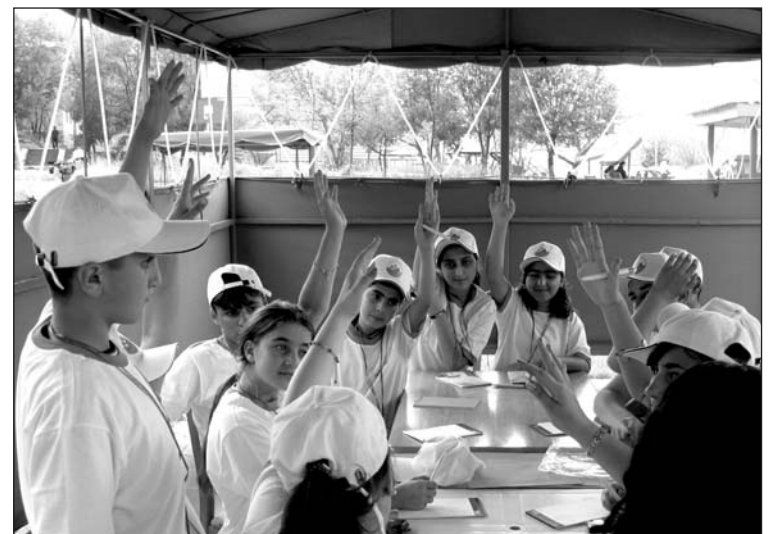
«Երիտասարդ սերնդի ձայնը» մանկապատանեկան ֆորումի մասնակիցները

Ինչևէ, լսեց նրանց կարծիքներն առանց մեկնաբանությունների, քանզի, ըստ իս, ամենակարևոր նպատակը, որ արտացոլված է հավաքի անվանման մեջ, արդեն իսկ իրականացված էր: Հայաստանի տարբեր շրջաններից եկած 14-19 տարեկան այս պատանիներն ու աղջիկները արտահայտեցին իրենց կարծիքները՝ փորձելով իրականությանը նայել «գեներային ակնոցով»: Եվ նույնիսկ նրանք, ում համար այս «ակնոցը» այնքան էլ հարմար չթվաց, կարող է հետագայում սովորեն ավելի լավ «տեսնել» կանանց և տղամարդկանց հավասարության հասնելու անհրաժեշտությունը: