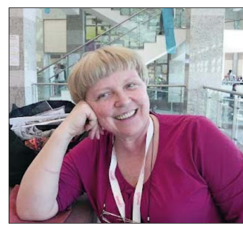
Մաքայն արտահայտելու: Կարևոր է, որ տարբեր մարդիկ այն արտահայտելու հնարավորություն ունենան: Թե մտտեցումներից ո՞րն է ճիշտ՝ ցույց կտա ժամանակը:

Անշուշտ, ես բոլոր մտտեցումներին համաձայն չեմ, սակայն ինչպես Կոլտերն էր ասում. «Ես չեմ կիսում ձեր կարծիքը, սակայն կյանքս կտամ, որպեսզի դուք հնարավորություն ունե-