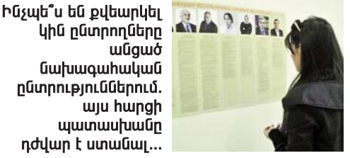
Ինչպե՞ս են քվեարկել կին ընտրողները անցած նախագահական ընտրություններում. այս հարցի պատասխանը դժվար է ստանալ...