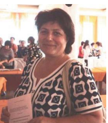
Իմ հարցին ի պատասխան, թե արդյոք պատրաստ է չորրորդ անգամ ևս առաջադրվել, հստակ այդով հավելեց՝ եթե բնակիչները դա ցանկանան ու ինձ նորից աջակցեն, ապա անպայման նորից կառաջադրվեմ...

Րական վերաբերմունք ունեն, բոլորովին: Որպես ապացույց էլ նշեմ, որ իմ տեղակալը տղամարդ է, ավելին՝ ընտրություններում իմ մրցակից թեկնածուի քիմից էր, բայց քանի որ լավ մասնագետ է, խելացի ու բանիմաց, ընտրվելուց հետո անմիջապես առաջարկեցի այդ պաշտոնը: