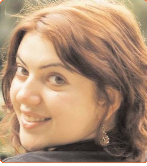
Կարծում եմ՝ աղջիկը կարող է անել ամեն ինչ: Նա պարզապես պետք է հավատա ինքն իրեն: