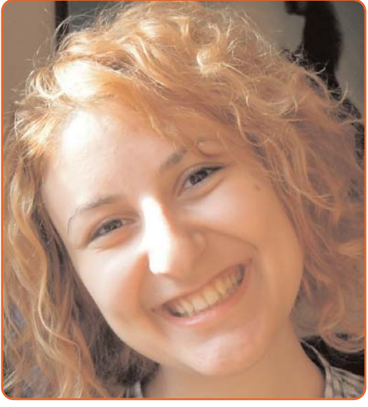
Ես այստեղ եմ, որովհետև երբեք չեմ կարողանա համակերպվել բռնության և անարդարության հետ: