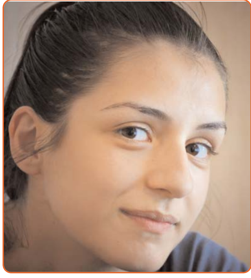
Յուրաքանչյուր կին, լինի հասուն թե երիտասարդ, իր ակտիվ գործունեությանը փոքրիկ հեղափոխություն է իրականացնում իր շրջապատում և իրականության մեջ առիտ ստարակ: