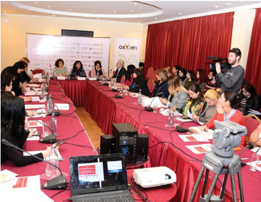
«Հավասար» քարոզարշավը նախաձեռնող կազմակերպությունները շնորհավորում են նորընտիր պատգամավորներին՝ հաջողություններ մաղթելով նրանց օրինակի գործունեության մեջ և հիշեցնելով, որ խորհրդարանական ընտրություններին ընդառաջ ներկայացված «Կանանց օրակարգը» շարունակում է ուժի մեջ մնալ: Ակնկալվում է հատկապես կին պատգամավորների ակտիվությունը «Կանանց օրակարգը» առաջ տանելու հարցում:

Հիշեցնենք, որ «Կանանց օրակարգը» մշակվել էր «Հավասար» քարոզարշավի շրջանակներում, որն իրականացվում է «ՕքսեՆ» երիտասարդության և կանանց իրավունքների պաշտպանության հիմնադրամի կողմից՝ WomenNet.am կայքի և «Ընտանիքի ակադեմիա» ՀԿ-ի հետ համագործակցությամբ: «Կանանց օրակարգը» ներկայացվել էր հանրությանը դեռ խորհրդարանական ընտրություններին ընդառաջ, քննարկվել էր ընտրություններին մասնակից քաղաքական ուժերի և կանանց ՀԿ-ների ներկայացուցիչների հետ: Սակայն այսօր էլ այն շարունակում է ուժի մեջ մնալ: Օրակարգի հիմնական նպատակն է նորընտիր Ազգային ժողովում ներկայացված պատգամավորների ուշադրությունը հրավիրել կանանց ու տղամարդկանց հավասարությունն ապահովող հիմնախնդիրների վրա, ակնկալելով, որ նրանք ոչ միայն կբարձրացնեն այդ հարցերը խորհրդարանի ամբիոնից, այլև լուծումներ կառայարկեն դրանց ուղղությամբ: Չէ՞ որ խորհրդարանական կառավարման պայմաններում ՀՀ Ազգային ժողովի մաս կազմող քաղաքական ուժերն են պատգամավորներին: