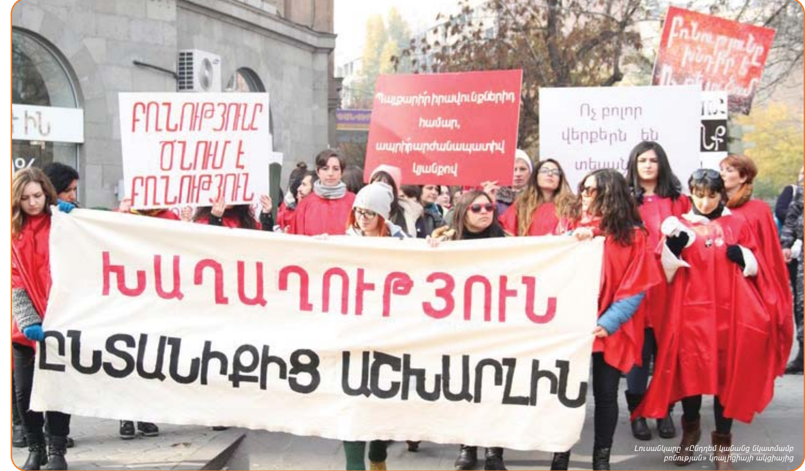
Լուսանկար՝ «Ընդդեմ կանանց նկատմամբ բռնության» կոալիցիայի ակցիայից