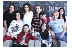
Girls in Tech. Աղջիկները՝ հանուն մարդասիրական գաղափարների