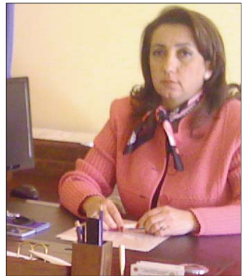
Ինչո՞ւ են նրանք դեմ քվեարկել: Ուզում են հասկանալ, որ արմատը գտնեն և այդ ուղղությամբ աշխատեն: Ցանկացած իրավիճակում միշտ փորձում եմ մեղքի իմ բաժինը գտնել...»

Ասում է՝ վերջին ընտրությանը 230 մարդ իրեն ձայն չի տվել: «Ես ուզում եմ հասկանալ նրանց դժգոհությունը, ի՞նչն է սխալ արել: