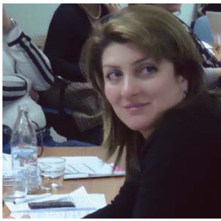
Երբ, որոնք հատկապես խորն են գյուղում, բացասաբար են ազդում կանանց վրա՝ սահմանափակելով ինքնադրսևորման նրանց հնարավորությունները: «Ուժեղ կանանց դրական են ընկալում միայն ուժեղ տղամարդիկ, ում հաճախ չես հանդիպի», - ասում է նա:

բուծությամբ: Ակտիվ մասնակցություն ունի հասարակական կյանքում, համայնքային մի շարք նախաձեռնությունների հեղինակ ու մասնակից է, ունի բազմաթիվ մտահղացումներ և նախագծեր, որոնց հիմքում համայնքի զարգացման մեջ իր լուծման ներդրելու մեծ ցանկությունն է: Նրա խոսքով՝ համագյուղացիները սկզբում չէին հավատում, որ ինքը կարող է բիզնեսով զբաղվել: Նրանք թերահավատությամբ էին նայում նրա ձեռնարկմանը և տարբեր սեմինարներին ու թրենինգներին նրա մասնակցությանը: Էկոլոգիապես մաքուր մթերքների արտադրության մասնագետի որակավորում էմման ստացել է Ռուսիայում: Գյուղում շատերը խեղ էին նայում նրա ուղևորությանը: «Շատերն ինձ հանդիմանում էին, որ ես մեռնալից ինչ-որ անհասկանալի սեմինար, և ո՞նց կարող է ամուսինը կնոջը մեռնալ թողնել ուրիշ երկիր գնալ», - պատմում է էմման: Նրա կարծիքով՝ հենց ամուսնու աջակցությունն ու ընթացումն օգնեցին իրեն անկախ և հաջողակ կին դառնալուն: Ասում է, որ կարծրատիպերն ու ավանդական բար-