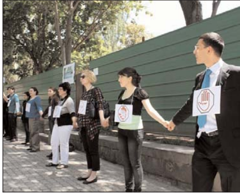
«Сегодня у нас нет старого Еревана, нет истории...»