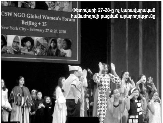
Փետրվարի 27-28-ը ոչ կառավարական համաժողովի բացման արարողությունը