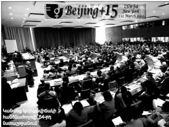
Կանանց կարգավիճակի համաժողովի 54-րդ նստաշրջանում