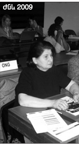
ժնև 2009 Գլխավորում ենք հավասար իրավունքների ու հավասար հնարավորությունների երաշխավորման մասին օրենքի ընդունման անհրաժեշտության մասին: Թե՛ հայեցակարգը և թե՛ օրենքը ՄԱԿ-ի ճարգացման ծրագրի աջակցությամբ արդեն իսկ մշակվել են Աշխատանքի և Սոցիալական հետազոտությունների ազգային ինստիտուտի կողմից, անցել միջազգային փորձաքննություն, սակայն մինչև հիմա չեն ընդունվել: