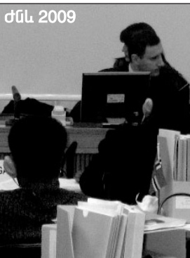
ժնև 2009 Կրում խտրականության ոչ միայն դեռ յուրե՛ն, այլև դե՛ ֆակտո վերացման համար, և պարտավոր է հատուկ մեխանիզմների ու ինստիտուտների օգնությամբ դրա համար ճանապարհ հարթել: Իր հանձնարարականներում Կոմիտեն կոչ է արել ավելի վճռակամորեն պայքարել մեր երկրում լայնորեն տարածված

Կանանց անբավարար ներկայացվածությունը քաղաքական և տնտեսական որոշումների կայացման մակարդակում Կոմիտեի հանձնարարականներում արտացոլված գլխավոր հիմնախնդիրներից է: Նշելով մեր կանանց բարձր կրթական մակարդակը՝ Կոմիտեի փորձագետներն ամբաբար խորհուրդ տվեցին հայտնել նրանց ցածր մասնակցությունը խորհրդարանում, կառավարությունում, տեղական իշխանություններում: Եզրափակիչ դիտարկումներում ՀՀ կառավարությանը, մասնավորապես, առաջարկվել է արագացնել ընտրական օրենսգրքում փոփոխություններ կատարելու գործընթացը՝ բարձրացնելով կանանց համար 15-տոկոսանոց քվոտան 20 տոկոսից ավելի մակարդակի: Առաջարկվել է լիովին արդարացված է, քանի որ մեզանում տղամարդկանց ու կանանց մեկնարկային հնարավորությունները անհավասար են և դրանց հավասարակշռման միակ միջոցը ժամանակավոր քվոտաներն են: Խոսքն այստեղ իրավական հավասարության մասին չէ, այլ հավասար հնարավորությունների և հավասար արդյունքների: Կոնվենցիայի տեքստում հատուկ ընդգծվում է, որ պետությունը, վավերացնելով այն, պատասխանատվություն է կրում խտրականության ոչ միայն դեռ յուրե՛ն, այլև դե՛ ֆակտո վերացման համար, և պարտավոր է հատուկ մեխանիզմների ու ինստիտուտների օգնությամբ դրա համար ճանապարհ հարթել: Իր հանձնարարականներում Կոմիտեն կոչ է արել ավելի վճռակամորեն պայքարել մեր երկրում լայնորեն տարածված