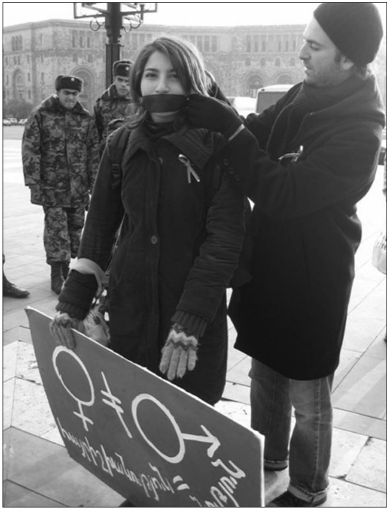
Խտրականությունն սկսվում է լուռ համաձայնությունից...

Այս բոլոր տվյալներն ուղղակիորեն առնչվում են կոնվենցիայի 1-ին հոդվածին և վկայում այն մասին, որ հասարակության մեջ չկա «կանանց խտրականություն» եզրին համապատասխանող ըմբռնում, և, համապա-